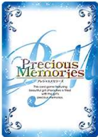
『劇場版 魔法科高校の劣等生 星を呼ぶ少女』 確定SRカード 1枚