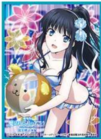
非売品カードスリーブ 20枚